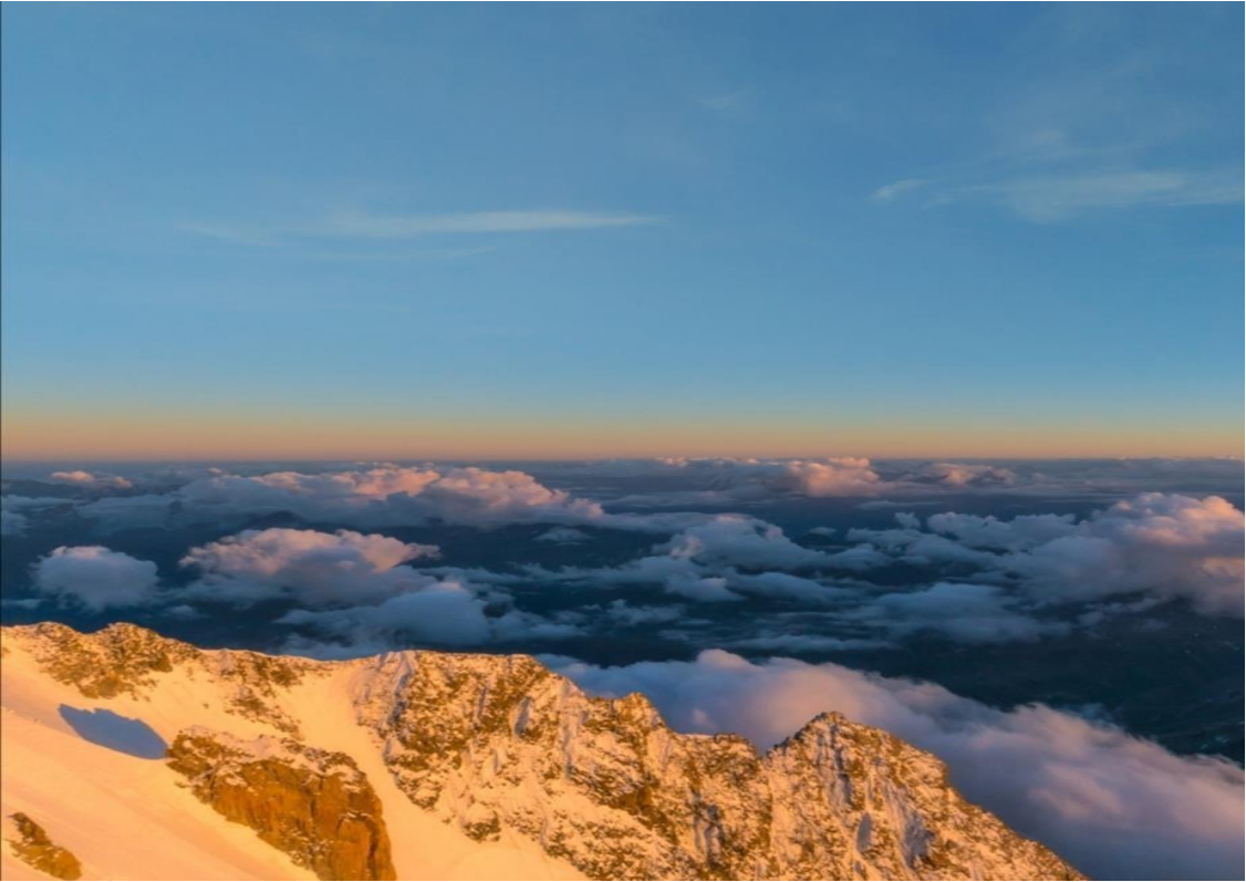
TEKİN GENÇ 2008